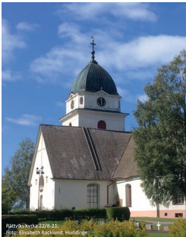
Rättviks kyrka 22/8-21.

Alla är alltid välkomna till Missionskyrkan!