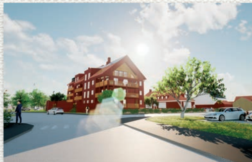
Mora Bygg AB

Är ni trötta på att höra era anställda klaga över kaffeautomaten eller gårdagens matchresultat? Det kan vi tyvärr inte hjälpa er med men med dessa ljuddämpande canvastavlor så blir butiken eller kontoret genast tystare.