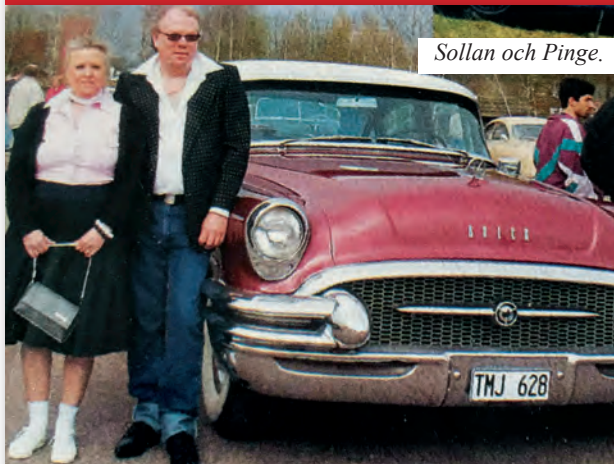
Sollan och Pinge.