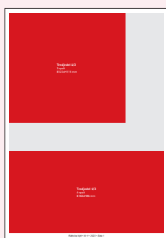
Tredjedel 1/3 3-spalt B122xH115 mm 4-spalt B163xH86 mm