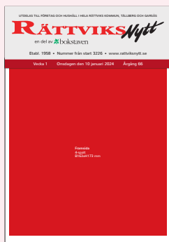
Framsida 4-spalt B163xH173 mm Utfall: + 10 mm/sida (ej utfall upptill)