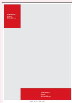
Tolftedel 1/12 1-spalt B40xH86 mm 3-spalt B122xH28 mm