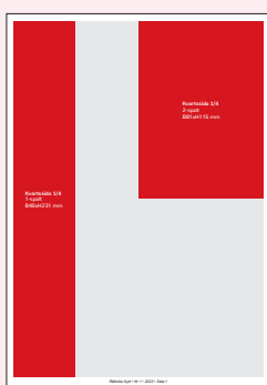
Kvartssida 1/4 1-spalt B40xH231 mm 2-spalt B81xH115 mm