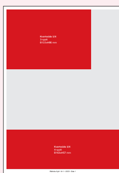
Kvartssida 1/4 3-spalt B122xH86 mm 4-spalt B163xH57 mm