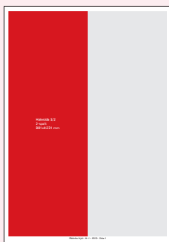
Halvsida 1/2 2-spalt B81xH231 mm Utfall: + 5 mm/sida