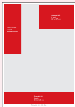
Åttondel 1/8 1-spalt B40xH115 mm 2-spalt B81xH57 mm 4-spalt B163xH28 mm