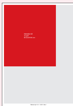
Halvsida 1/2 3-spalt B122xH144 mm