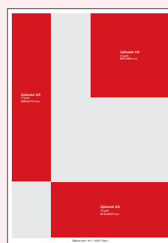
Sjättedel 1/6 1-spalt B40xH173 mm 2-spalt B81xH86 mm 3-spalt B122xH57 mm