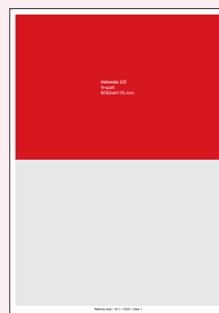
Halvsida 1/2 4-spalt B163xH115 mm Utfall: + 5 mm/sida