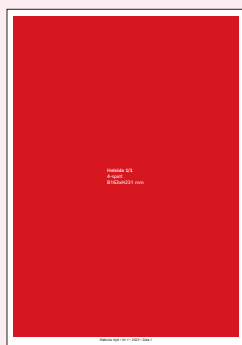
Helsida 1/1 4-spalt B163xH231 mm Utfall: + 5 mm/sida