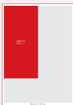
Tredjedel 1/3 2-spalt B81xH173 mm