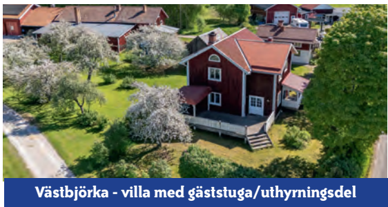
Västbjörka - villa med gäststuga/uthyrningsdel

Villa i bra skick beläget i Västbjörka med ca 10 min bilväg till Vikarbyn med skola, affär, bad samt Tammeråsen med fina skidspår. Boarea ca 125 kvm 5 rok, hall, duschrum, badrum, klädkammare, tvättstuga, pannrum. Vidare finns vedpanna för 1/2 m ved, öppen spis, stor förrådsvind. Gäststuga 2 rum och pentry, duschrum, braskamin samt vedbod och stort förråd i bottenplan. Carport. Fastigheten är besiktigad- energi deklarerad E-klass D, E-prestanda 108 kWh/kvm per år-brandskydds kontrollerad.