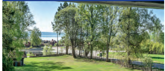
Vikarbyn - Carl Larsson-inspirerat timmerhus

Fritid eller mindre permanent boende i timmer och med utsikt över Siljan samt stor tomt och gångavstånd till bad, affär, restauranger i Vikarbyns centrum samt bra bussförbindelser Mora-Falun. Boarea 73 kvm 4 rok, hall, duschrum, sep wc. Vidare finns öppen spis, kommunalt VA, loftbalkong, friggbod. Inventarier och lösöre ingår och fastigheten övertages i befintligt skick. Fastigheten är besiktigad- energi deklarerad E-klass C E-prestanda 174 kWh/kvm per år-brandskydds kontrollerad.