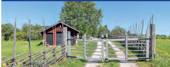
Boda - med högt insynsskyddat läge och stor tomt

Fritid eller mindre permanent boende med högt, fritt och insynsskyddat läge i Boda. Renoverat senaste åren och i mycket bra skick. Närhet till badplats Sinksjön, affär, skola m.m. i Boda. Fina strövområden runt knuten. Boarea ca 60 kvm 3 rok med matplats, hall, duschrum. Vidare finns braskamin, luftluftvärmepump, stor altan, garage, lekstuga, källare med 2 gästrum, matkällare, teknikrum som även går att inreda till duschrum. I källaren kvarstår lite renovering. Underbar uppvuxen trädgårdstomt med gårdesgård och flertalet olika fruktträd, vildhallon, vinbär, jordgubbar, potatisland m.m.